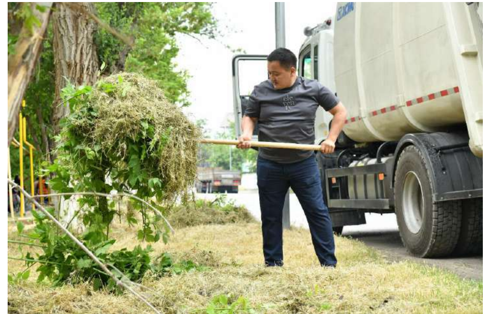
Бетті дайындаған Тілек КАБЫЛ

Айта кетейік, «АМАНАТ» партиясының «Таза бейсенбі» экологиялық акциясы еліміздің өзге өңірлерінде де өткізілді.